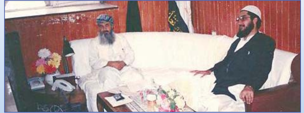
ښاغلی استاد مذهبي او د هرات پخوانی والي ښاغلی محمد اسماعیل په یوه دوستانه کتنه کې- کال ۱۳۷۲ Ustad Mutasim Billah Mazhabi in a Meeting with General Amir Ismayel Khan (Minister of Power & Energy) (1993)