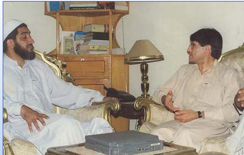
ښاغلي استاد معتصم بالله مذهبي او ښاغلي انوار الحق احدي د افغانستان د خلکو د اسلامي شورا په انگرېکي د هېواد د مسائلو په اړه د خبرو اترو په حال کې - پېښور - کال ۱۳۷۷ Ustad Mutasim Billah Mazhabi and Anwar-ul-haq Ahadi (Ex. Finance Minister) discussing National political issues (1998)