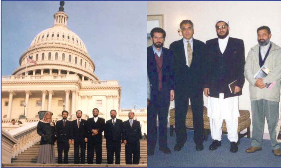
هیئت عالی‌رتبه شورای اسلامی مردم افغانستان به ریاست استاد معتصم بالله مذهبی توانست توجه مجامع جهانی را به واقعیت‌های موجود افغانستان جلب نماید منجمله آقای زلمی خلیلزاد و اعضای مجلس سنای آمریکا - سال ۱۳۷۷

Ustad Mutasim Billah Mazhabi leading a high level Islamic Council of The People of Afghanistan (ICPA) delegation to the world leaders meeting US Government Senate members and diplomats including Zalamai Khalilzad (Ex. US Ambassador to Afghanistan) (1998)