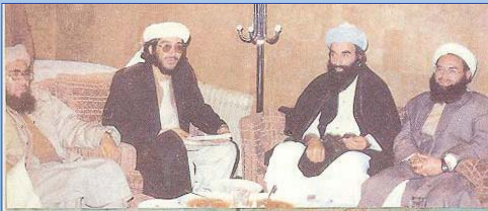
استاد معتمد بالله مذهبی حین ملاقات با رهبران جهادی منجمله حضرت صبغة الله مجددی، استاد برهان الدین ربانی، شهید احمد شاه مسعود و مولوی محمد نبی محمدی