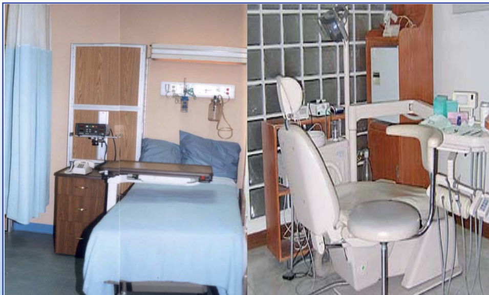
منظره ای از «فلاح پولی کلینیک» در دوران هجرت