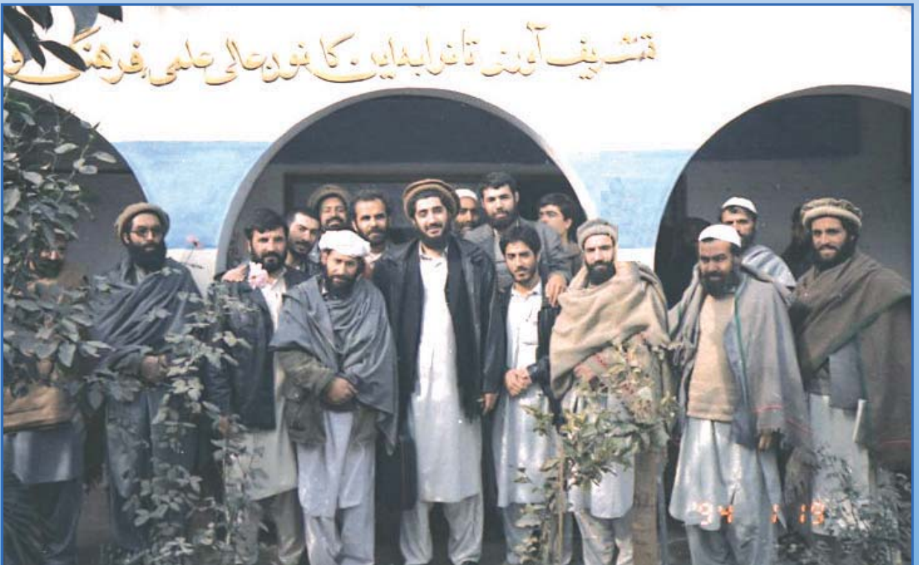
نمایی از فیضانی کتابخانه و کانون فرهنگی علامه فیضانی در دوران هجرت - سال ۱۳۶۷ A view of Alama Faizani Library and Cultural Center in exile (Peshawar) (1988)