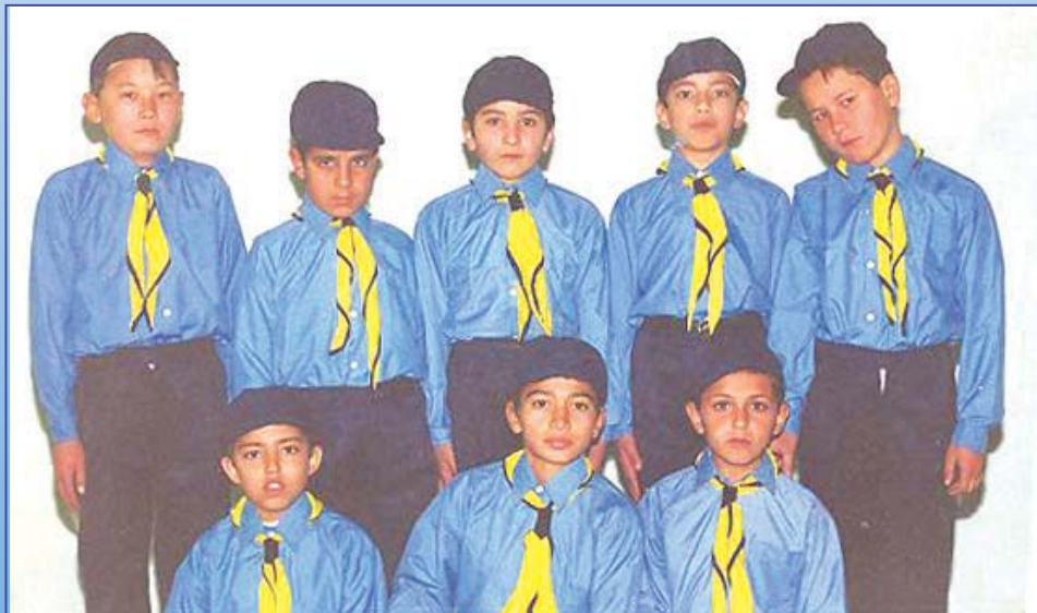
عده ای از شاگردان مکتب غلام دستگیر شهید ملبس با یونیفورم خاص - سال ۱۳۷۵

A scene of Falah Poly Clinic established by Ustad Mutasim Billah Mazhabi