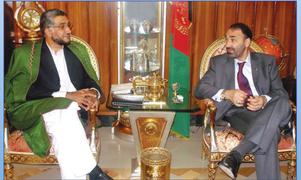
د افغانستان ولسمشرۍ ته نوماند ښاغلی استاد معتصم بالله مذهبي او د بلخ والي ښاغلی استاد عطا محمد نور د هېواد د برخليک په اړه خبرې اترې کوي. کال ۱۳۸۷ Ustad Mutasim Billah Mazhabi in a meeting with Ustad Attah Mohammad Noor Governor of Balkh (2008)